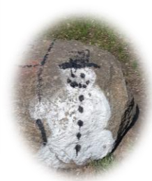
Bild 1 --> 30 Sekunden lang so viele Hampelmänner wie du kannst. Wie viele hast du geschafft? _____

Bild 2 --> 30 Sekunden lang so viele Hockstrecksprünge wie du kannst. Wie viele hast du geschafft? _____